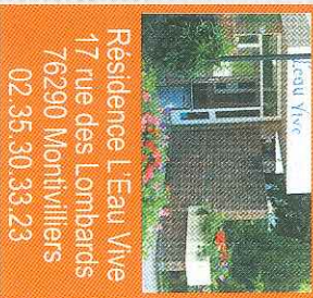
Résidence L'Eau Vive 17 rue des Lombards 76290 Montivilliers 02 35 30 33 23