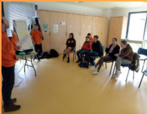
Table ronde «Les Centres Sociaux acteurs de l'inclusion»